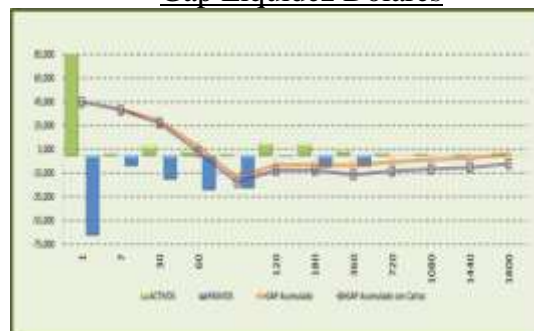
Gap Liquidez Dólares

De manera diaria se da seguimiento a la liquidez de divisas conforme al régimen de inversión en moneda extranjera para dar cumplimiento con la regulación actual, de esta forma se garantiza que no se encuentren descalces que signifiquen algún riesgo en la ejecución de las obligaciones futuras. Así mismo, en el Comité de Activos y Pasivos (ALCO) se exponen diferentes ratios regulatorios e internos, dentro de estos se encuentra el gap de liquidez en moneda extranjera donde se solicita que el gap acumulado permanezca positivo, en caso contrario se ejecutan medidas para resolver el descalce.